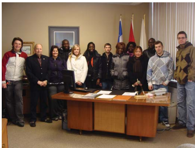
Groupe PAJ Automne 2009 - photo prise lors de la visite à Ville de La Tuque

Année après année, les séjours exploratoires connaissent un véritable succès. Maintenant offerts durant deux fins de semaine, les séjours sont une formule gagnante pour attirer les gens chez nous. Quoi de mieux que de vivre des activités et de rencontrer des gens pour mieux connaître un milieu. Visite d'entreprises, rencontre d'employeurs, conférences, formations et j'en passe, voilà ce que Place aux jeunes offre aux participants et les résultats parlent d'eux-mêmes. En moyenne, c'est environ 50 % des participants qui s'établissent finalement à La Tuque après leur participation. La collaboration des partenaires est aussi grandement appréciée. Cette année, ce ne sont pas moins de 34 personnes qui se sont jointes à l'une ou l'autre des activités.