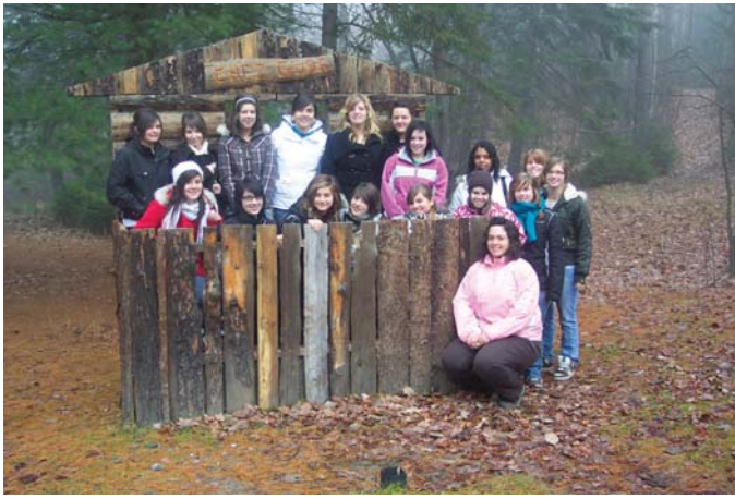
Groupe PAJ Ados 2008