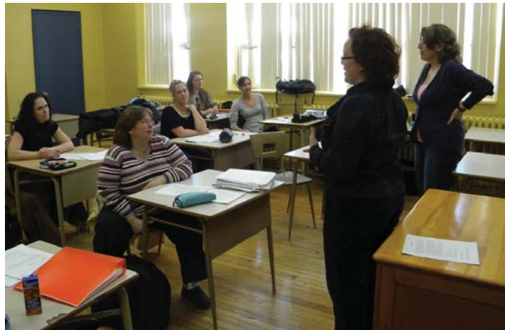
Atelier de recherche d'emploi animé au centre d'études collégiales, programme de soins infirmiers

Fort probablement que oui! Les étudiants que nous rencontrons apprécient les conseils offerts, d'autant plus qu'ils amorcent ou amorceront à court terme une recherche professionnelle dans un domaine donné.