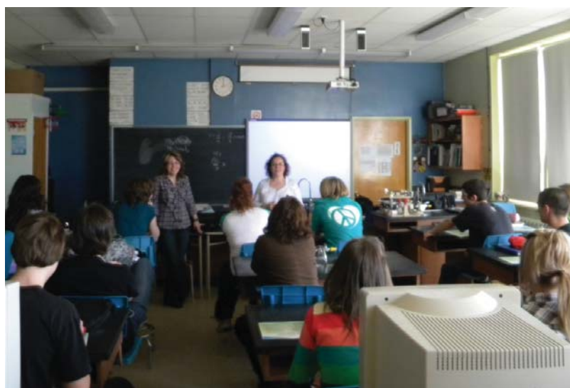
Atelier de recherche d'emploi animé au High School en sec. IV

Notre atelier consiste sommairement à présenter les pistes de réflexion préalables à la recherche d'un emploi. Des vrais ou faux nous permettent ensuite d'aborder les questions courantes quant au curriculum vitae lui-même, la recherche d'emploi proprement dite et la rencontre à l'employeur. Bien que plusieurs jeunes prennent rendez-vous à nos bureaux, quelques-uns choisiront tout de même de créer leur curriculum vitae par leurs propres moyens. Nous leur indiquons alors les sections courantes du document et les informations à préciser. Nous terminons par la correction d'un curriculum vitae qui comprend à la fois des erreurs de français, mais également des éléments ne devant pas s'y retrouver. En terminant, nous leur remettons une grille aide-mémoire avec les conseils d'usage à tout chercheur d'emploi.