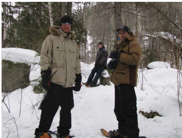
Activité de raquettes

Dans le cadre du projet « Jeunes en action », on n'a pas le temps de s'ennuyer. Les jeunes d'aujourd'hui disent souvent: « L'hiver, c'est plate! Y'a rien à faire! Il fait froid et je n'ai pas de linge! C'est long chez nous à rien faire! ». Ce n'est pas vrai puisqu'ici, à La Tuque, nous avons la grande chance de pouvoir faire des sports d'hiver. Par contre, on doit les faire découvrir davantage aux jeunes qui ont peu de moyens financiers.