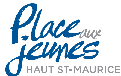
Josée Duchemin Agente de migration Place aux jeunes/Desjardins