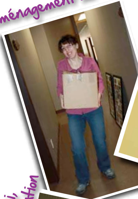
Déménagement du CJE