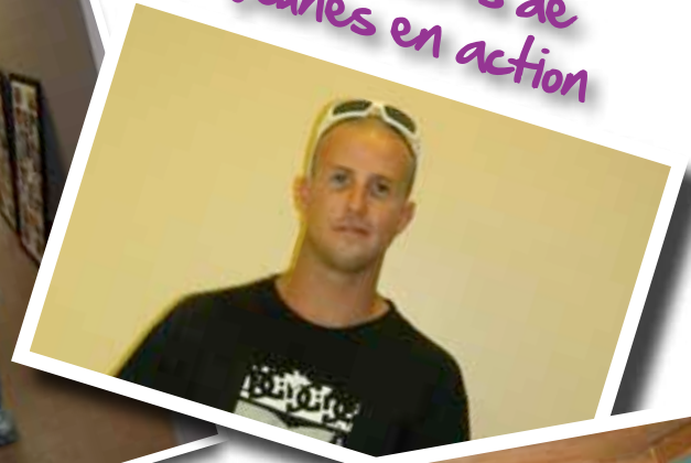
Réussites de Jeunes en action