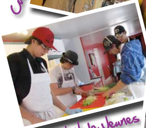
Dîner de Noël de Jeunes en action