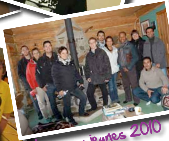
Place aux jeunes 2010