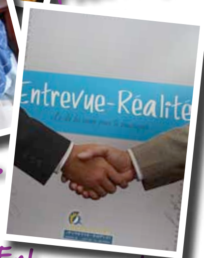
Entrevue-réalité: un tout nouvel outil