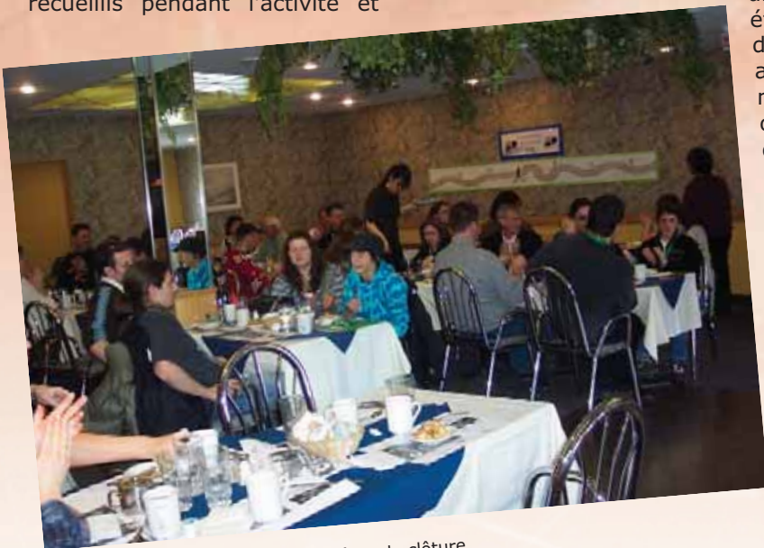
Dîner de clôture

Par Josée Duchemin, responsable du projet