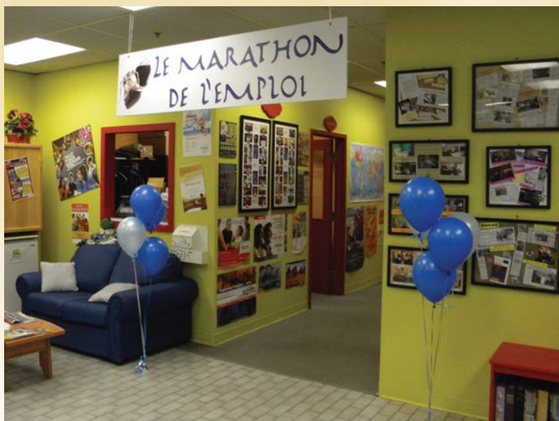
Le hall d'entrée du CJE s'était fait une beauté pour l'occasion