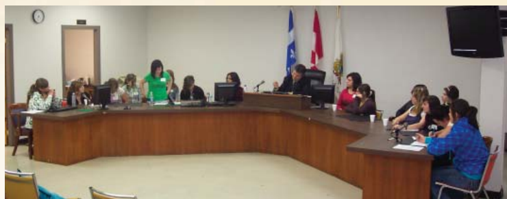
Débat argumentaire sur la vie en région