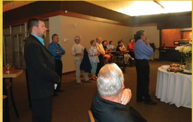
Quelques-uns des intervenants ayant assisté au lancement de la cellule de mentorat d'affaires, le 2 septembre dernier.

Depuis le 2 septembre dernier, les entrepreneurs et gestionnaires de la région peuvent choisir entre ces deux probabilités de réussite grâce à la nouvelle cellule de mentorat d'affaires latuquoise. C'est devant plus d'une trentaine d'intervenants politiques, économiques et médiatiques que le Carrefour jeunesse-emploi (CJE) a dévoilé en grande pompe ce tout nouveau service. Le CJE souhaite ainsi faciliter la croissance des entreprises en augmentant leur taux de survie.