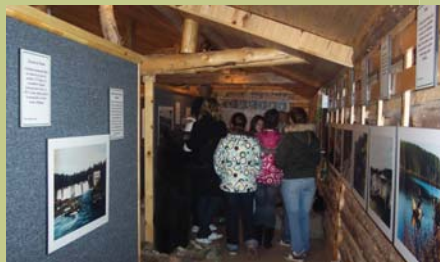
Visite au Parc des chutes