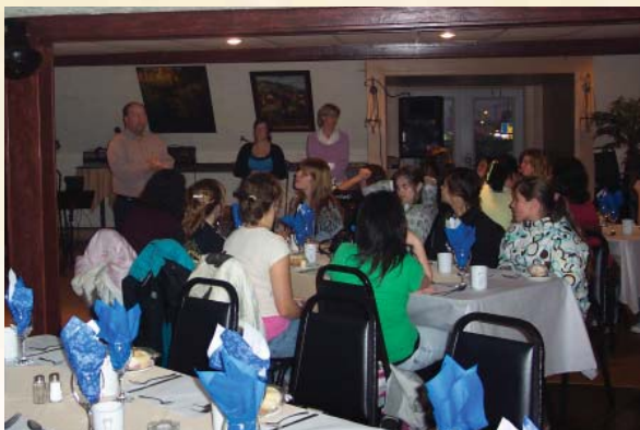
Souper de clôture

Agente de migration Place aux jeunes/Desjardins